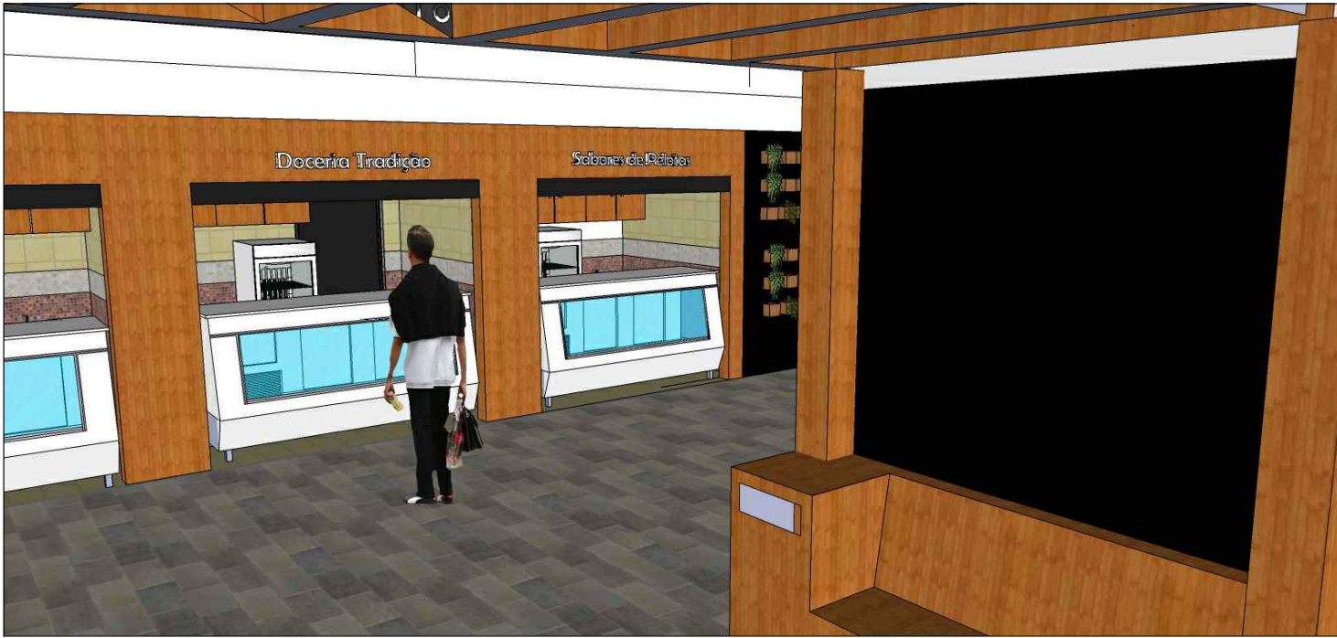
Vista interna da Rua do doce