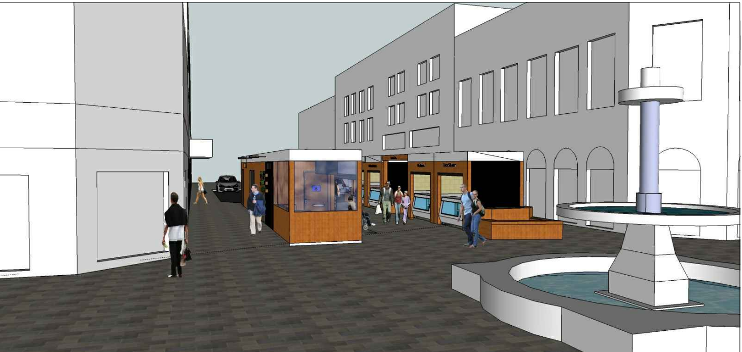
Vista da esquina com a Rua Andrade Neves