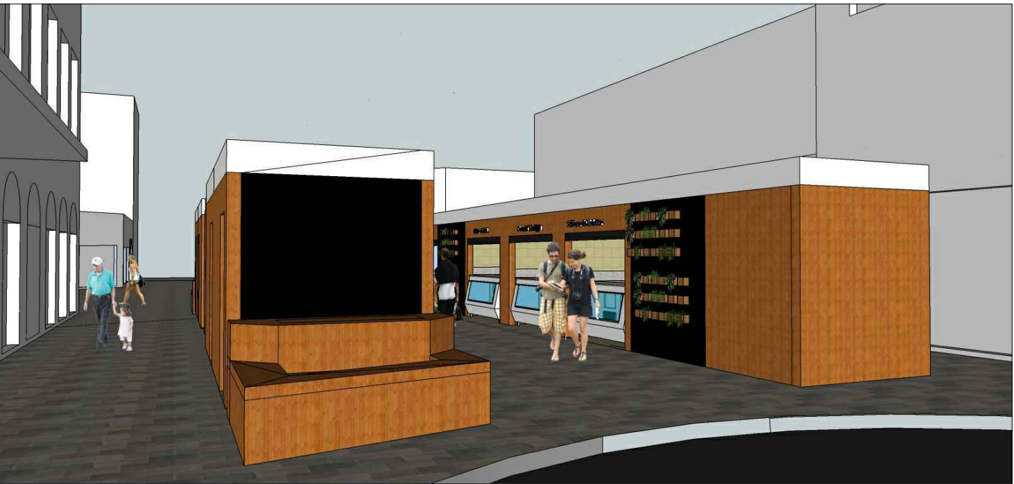
Vista da esquina com a Rua Gen. Osório