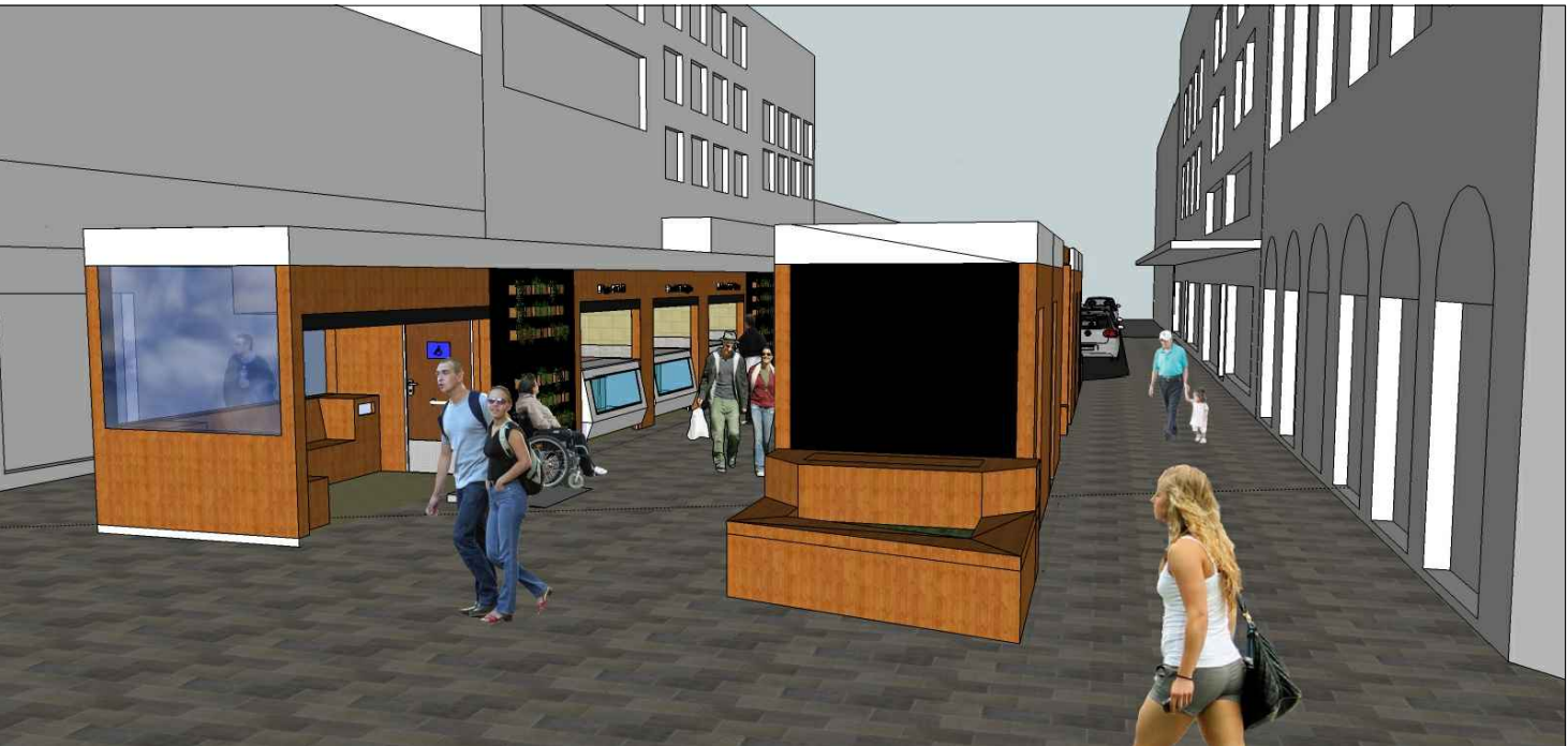
Vista da esquina com a Rua Andrade Neves