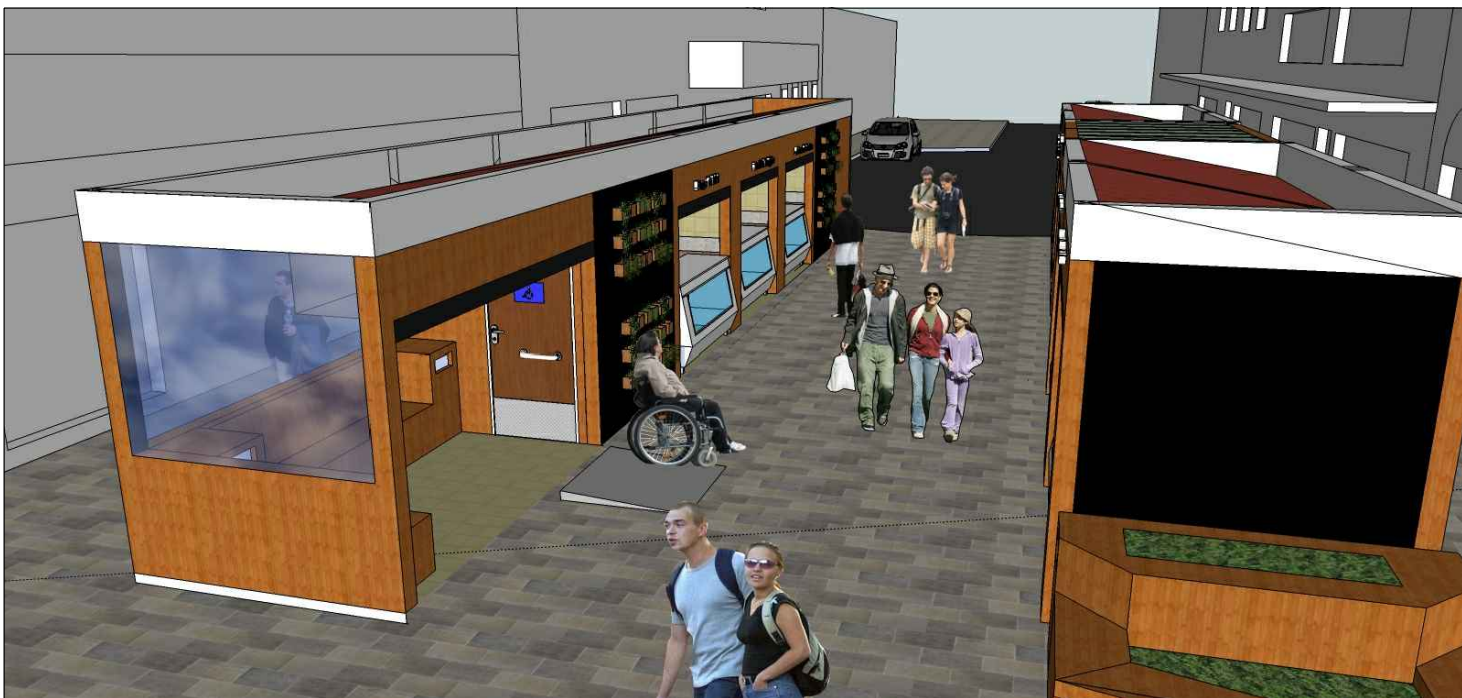
Vista da esquina com a Rua Andrade Neves