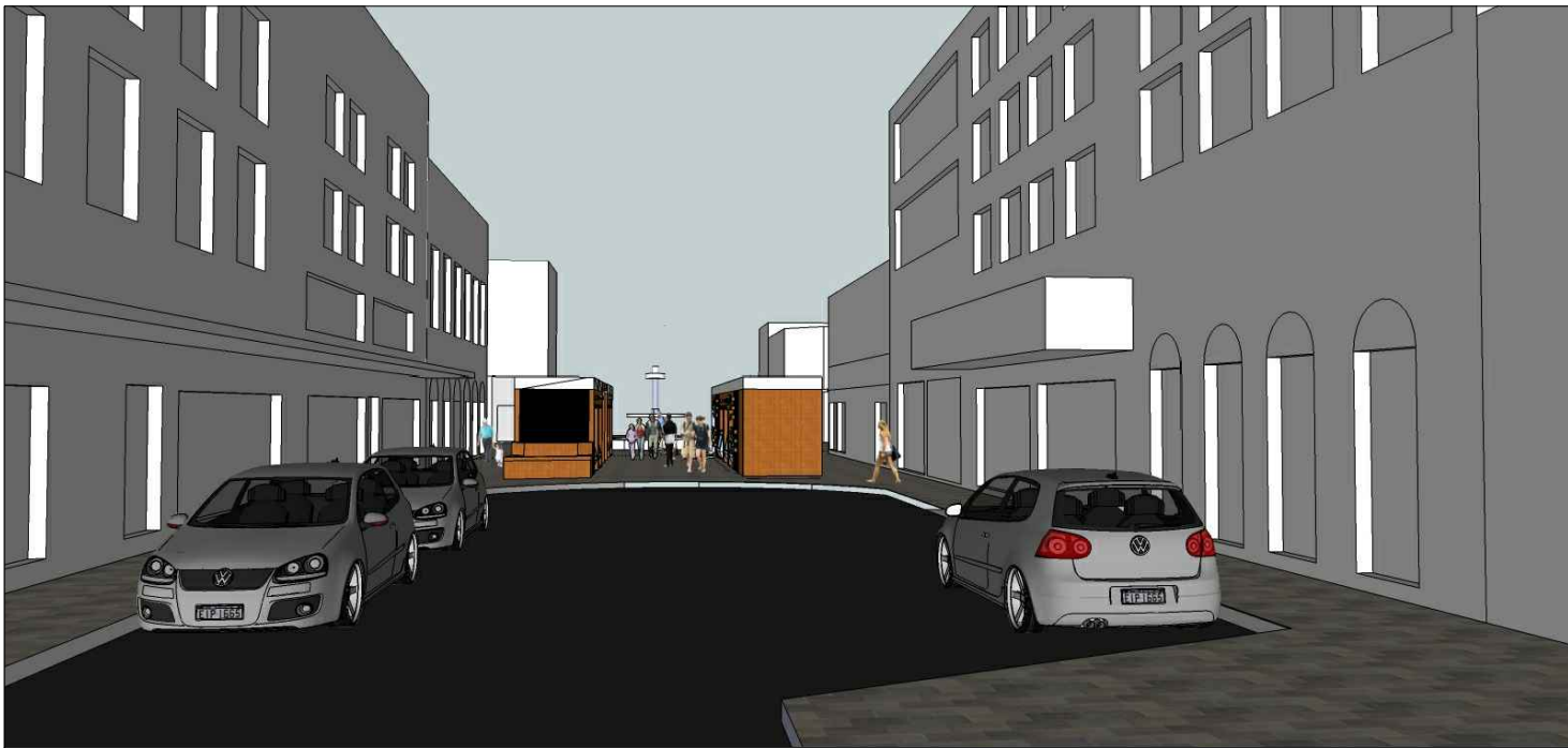
Vista da esquina com a Rua Gen. Osório