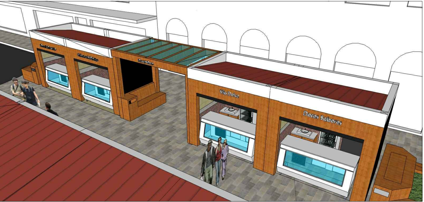
Vista interna da Rua do doce