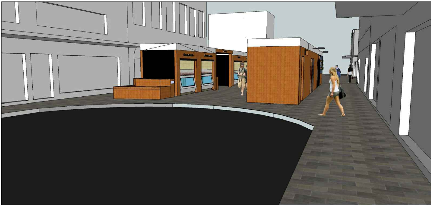
Vista da esquina com a Rua Gen. Osório