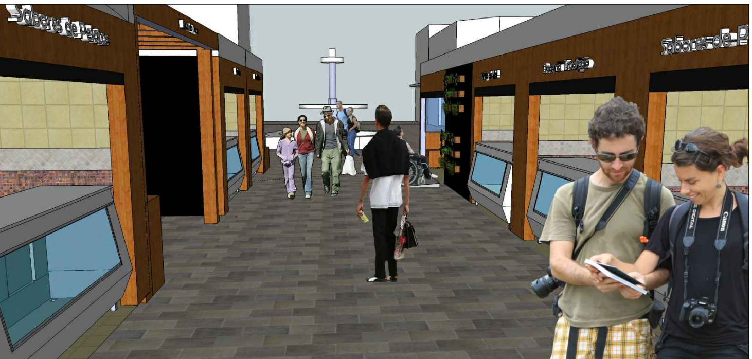
Vista interna da Rua do doce